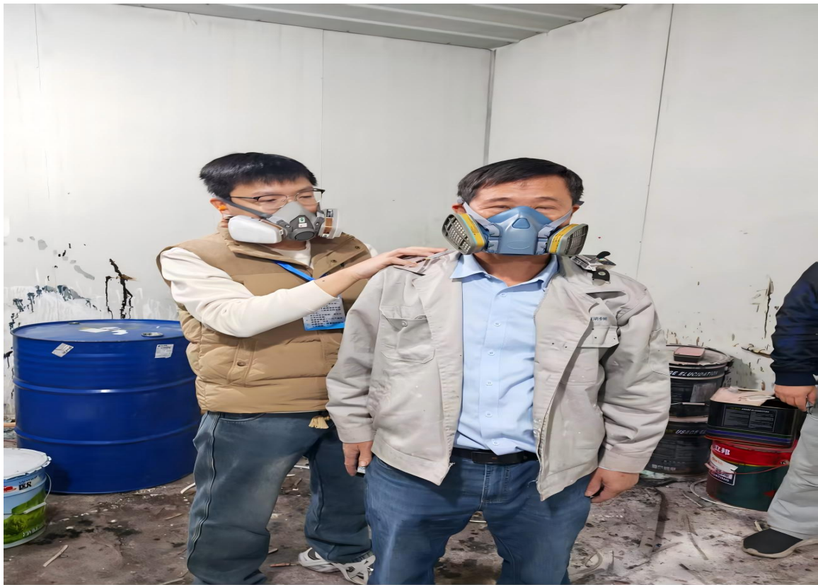
HONOR Magic7 Pro